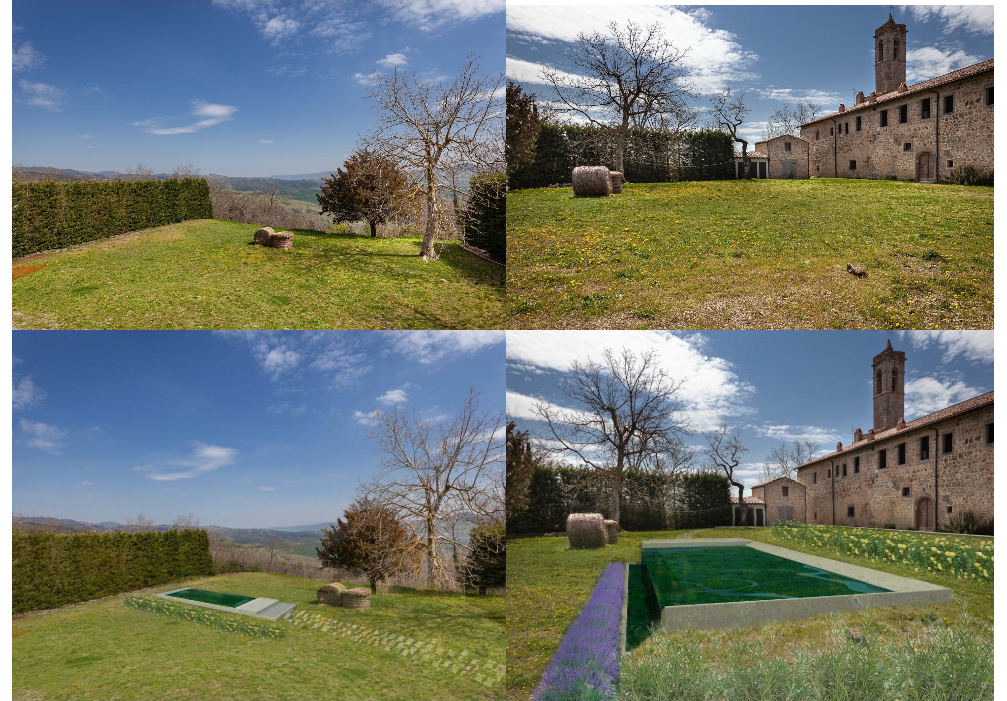
FOTOSIMULAZIONI INTERVENTO PISCINA