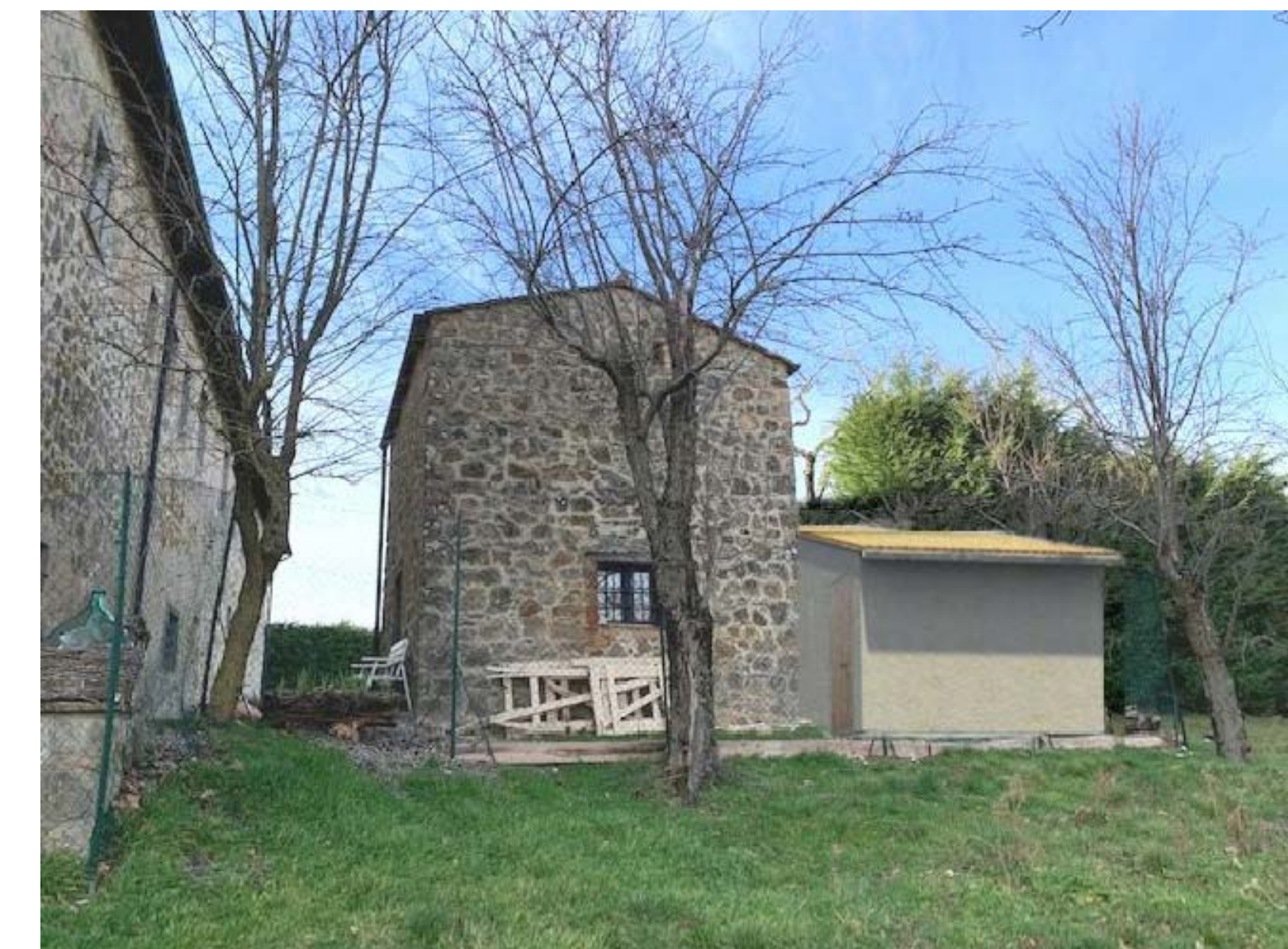
FOTOSIMULAZIONI INTERVENTO AMPLIAMENTO